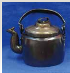
Слева: Чайник. До реставрации.