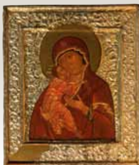
Слева: Икона Богоматерь Владимирская. До реставрации.