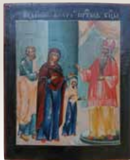
Слева: Икона Введение во храм. До реставрации.