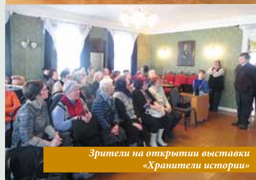
Зрители на открытии выставки «Хранители истории»