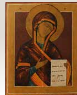
Слева: Икона Богоматерь. До реставрации.