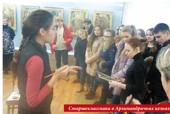
Старшеклассники в Архимандричьих кельях