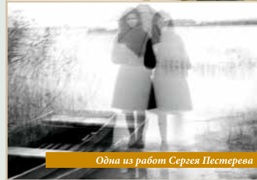
Одна из работ Сергея Пестерева

Заказ экскурсий и справки по телефонам: в Кириллове 8(81757) 314-79 в Феропонтове 8(81757) 49-261