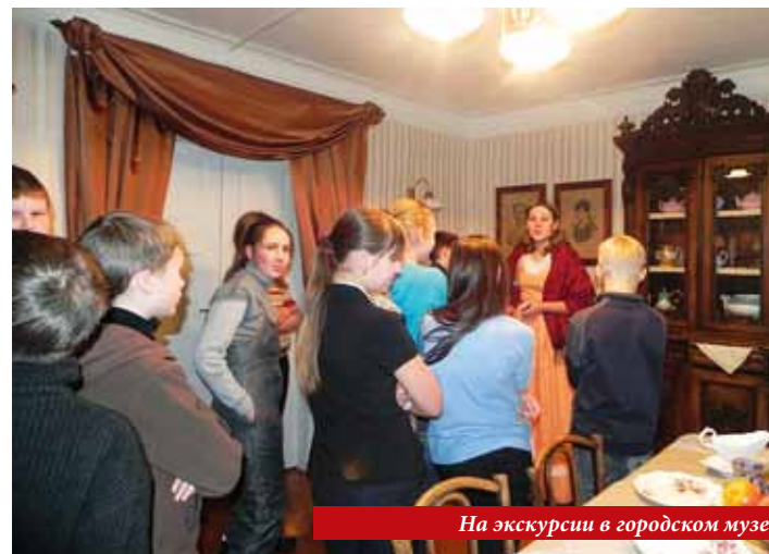
На экскурсии в городском музее

«Печка-магушка» и «Уездный город Кириллов».