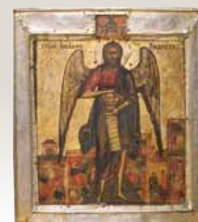
Слева: Икона Иоанн Предтеча. До реставрации.